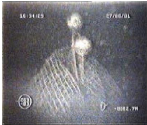
Shipwreck covered with fishing nets in the Baltic Sea