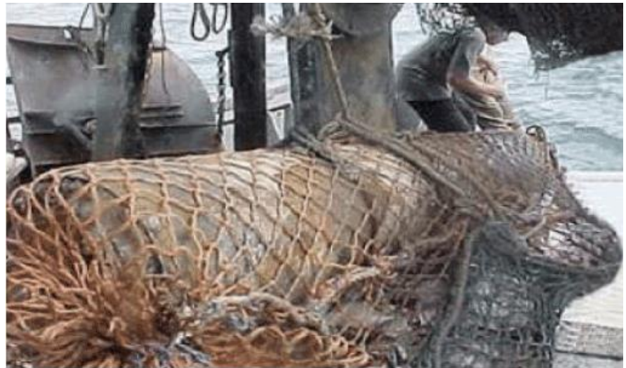
A munition caught in a fishermen's net