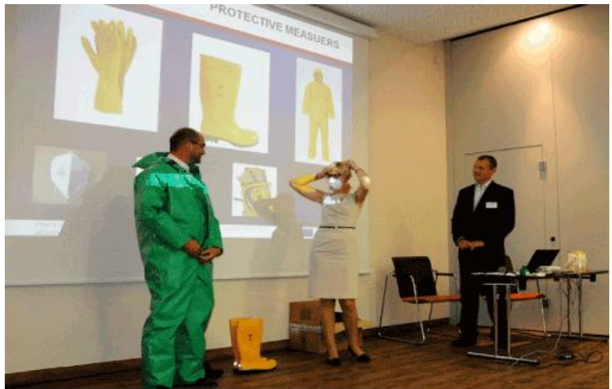
CHEMSEA Awareness Training for fishermen workshop held in Klaipeda, Lithuania